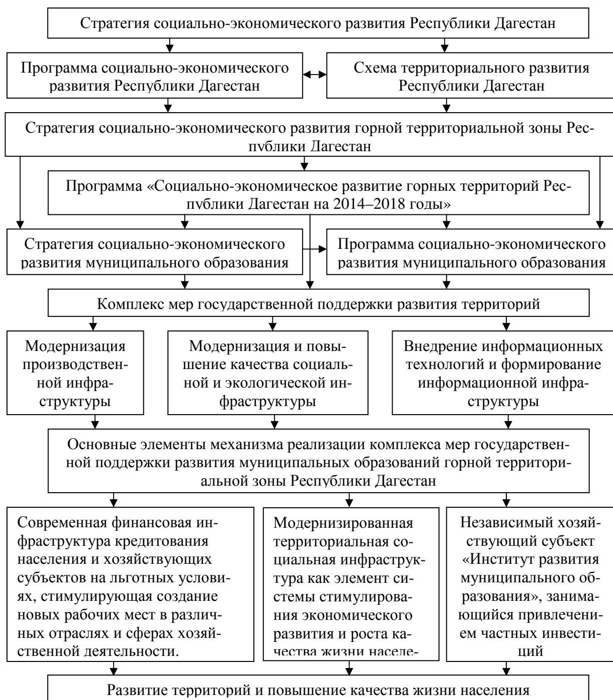
Рис. 4. Система государственной поддержки развития территорий (разработан автором)

новых рабочих мест в различных отраслях и сферах хозяйственной деятельности. Приоритетным может стать развитие системы микрокредитования на льготных условиях действующих малых хозяйствующих субъектов или стимулирование создания новых, ориентированных на переработку сельскохозяйственной продукции, оказание услуг, производство промышленной и строительной продукции и т.д. При этом система льготного кредитования целесообразно ориентировать на содействие развитию инфраструктуры и предпринимательства в муниципальном образовании. Кроме того, одним из проблем развития малого предпринимательства в горной территориальной зоне является отсутствие собственного капитала для открытия и обеспечения развития пред-