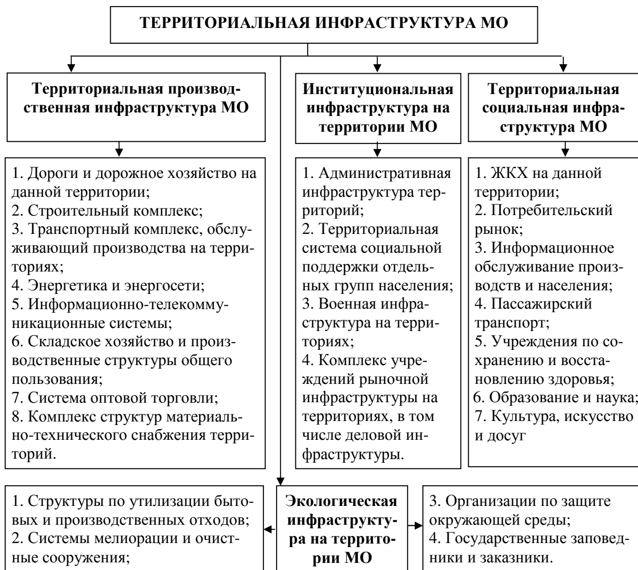
Рис. 1. Состав территориальной инфраструктуры муниципального образования (классификация авторская)

От эффективности функционирования территориальной инфраструктуры напрямую зависит как качество жизни населения, так и уровень развития экономики данной территории. В целом эффективность различных производств определяется не только количеством построек, техники, технологий, а сколько развитой территориальной инфраструктурой. Именно данный фактор способен обеспечить при благоприятных условиях действия ощутимый для территории комплексный социально-экономический и экологический эффект. Все это требует активизации инвестиционного процесса на территориях.