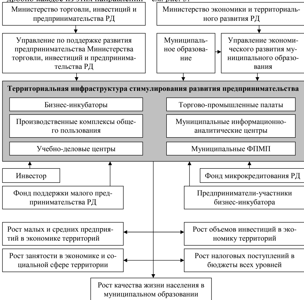
Рис. 5. Механизм формирования и функционирования территориальной инфраструктуры стимулирования развития предпринимательства в муниципальном образовании (разработан автором)

ниципальных образований на горных территориях региона. Рассмотрим подробно каждое из этих направлений – см. рис. 5.