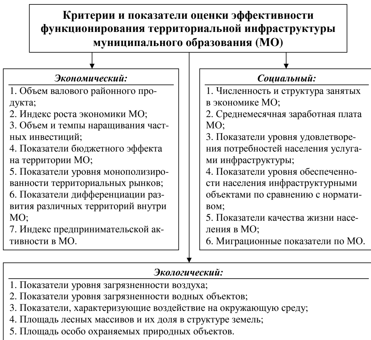
Рис. 2. Критерии и показатели оценки эффективности функционирования территориальной инфраструктуры муниципального образования (группировка разработана автором)

В настоящее время, в процессе управления формированием, содержанием и развитием территориальной инфраструктуры муниципального образования в регионе не всегда учитывается региональная специфика формирования и функционирования объектов территориальной инфраструктуры, менталитет и этнокультурные особенности местного населения, топонимическое строение территорий, что приводит к серьезным упущениям и искажениям их реальной роли в социально-экономической системе региона.