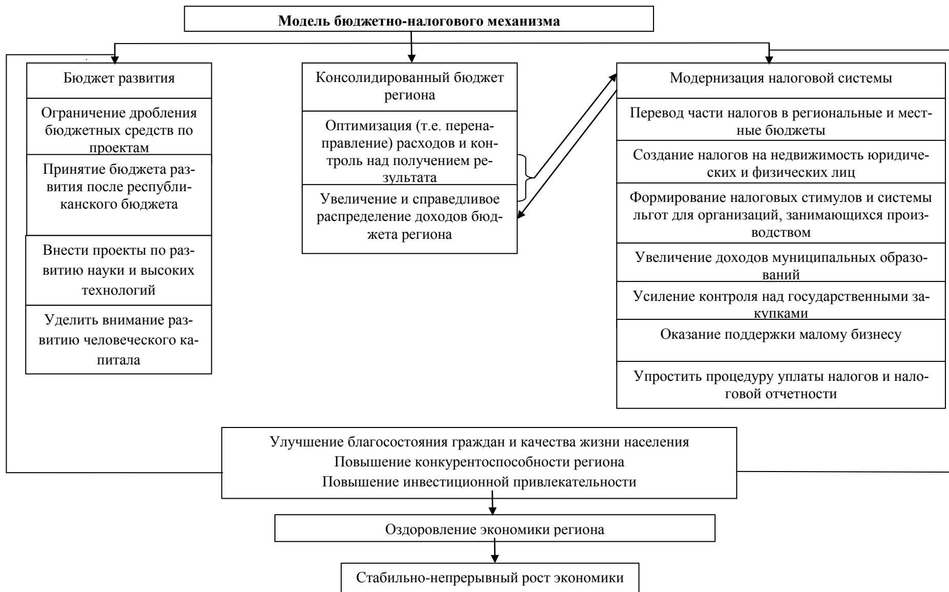
Рис. 1. Бюджетно-налоговый механизм в стимулировании устойчивого развития региона