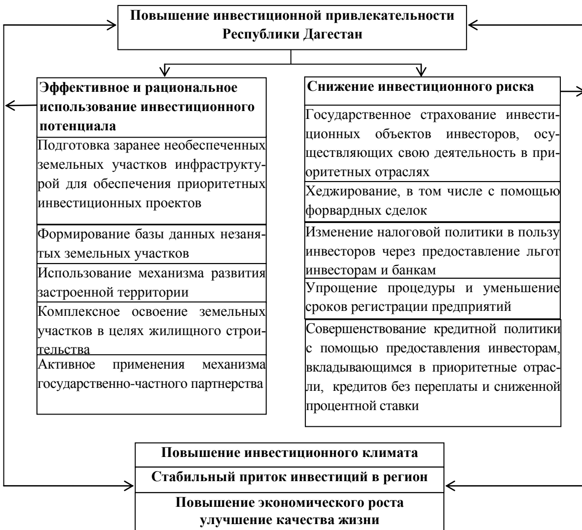
Рис. 3. Алгоритм улучшения инвестиционной привлекательности Республики Дагестан

Для повышения инвестиционной привлекательности Дагестана, а, следовательно, для улучшения социально-экономического положения, больший упор следует делать на снижение инвестиционного риска, тем более это совокупность факторов, которая наиболее легко изменяется с помощью действий региональных органов. Так, автором представлен алгоритм улучшения инвестиционной привлекательности Республики Дагестан (см. рис.3), где показана прямая зависимость повышения инвестиционной привлекательности республики от повышения инвестиционного климата за счет эффективного использования инвестиционного потенциала и снижения инвестиционного риска с помощью предложенных мер.